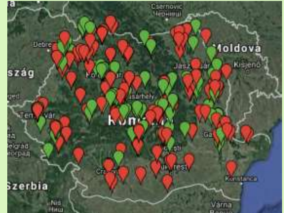
Școli Prietenoase cu Natura - ediția I